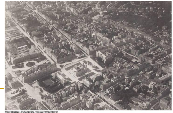
POGLED NA HNKI I CENTAR GRADA, 1898. (VATROSLAV REPIC)